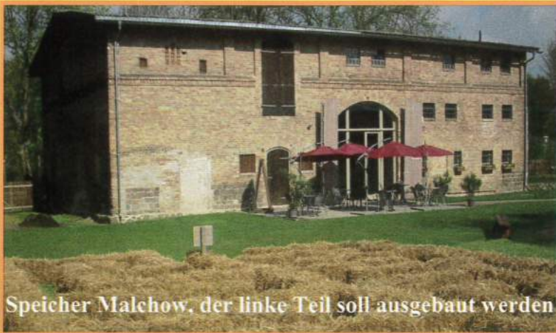
Speicher Malchow, der linke Teil soll ausgebaut werden